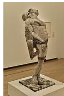
Persona. Homenaje a Cataluña, 1979-1980

Colección Museo Nacional de Bellas Artes